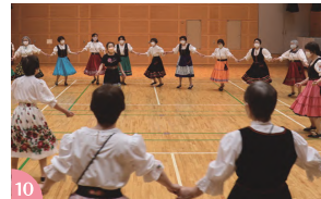
⑩：全員で輪になって踊るフォークダンス ⑪：青森県に古くから伝わる民謡「津軽小原節」 ⑫：心地よいメロディーと踊りを楽しむフラダンス