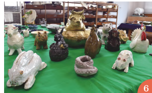
⑥：十二支が勢ぞろいしていた陶芸コーナー ⑦：面白おかしく話す忍者紙芝居に夢中