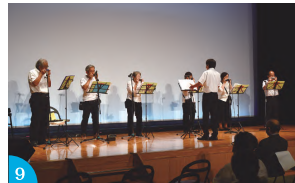
⑧：力強い演奏が鳴り響いた器楽合奏 ⑨：優しい音色に癒されるハーモニカ演奏